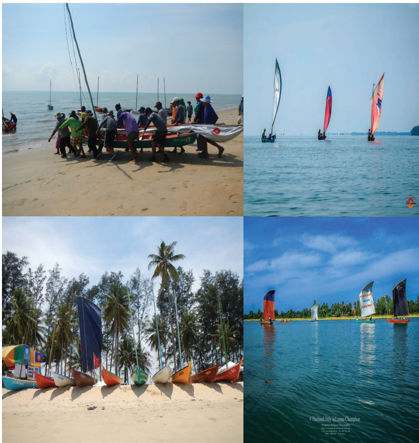
ภาพที่ 1 : ภาพการแข่งขันเรือใบพื้นบ้านในพื้นที่อำเภอแฉะ