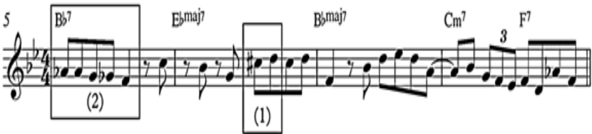
ภาพที่ 5 : แนวทำนองบทเพลง Moose the Mooche ห้องที่ 5-8

บทเพลง Moose the Mooche ด้านแนวทำนองมีลักษณะของแนวทำนองบีบ๊อป กล่าวคือการนำเสนอแนวทำนองด้วยแนวคิดการใช้โน้ตครึ่งเสียง ซึ่งเป็นโน้ตที่ไม่ได้อยู่ใน กุญแจเสียงหลัก (ฉนิษฐา พันธุ์เจริญ, 2552) เป็นโน้ตผ่านไปยังโน้ตเป้าหมาย (Target Notes) เช่น การใช้โน้ต C# เคลื่อนที่เข้าหาโน้ต D ปรากฏขึ้นในแนวทำนองห้องที่ 6 ซึ่งโน้ต D เป็น โน้ตลำดับที่ 7 ในคอร์ด Ebmaj7 (จุดสังเกต 1 ภาพที่ 5) นอกจากนี้ยังปรากฏแนวคิดการใช้โน้ตครึ่งเสียงอีก เช่น ห้องที่ 5 ตรงคอร์ด Bb7 แนวทำนองเริ่มเคลื่อนที่ลงครึ่งเสียงจาก โน้ต Ab มายังโน้ต F โดยเริ่มจากโน้ต Ab เคลื่อนที่ลงมายังโน้ต G-Gb เคลื่อนที่ลงมายัง โน้ต F ตามลำดับ สังเกตว่าโน้ตตัวขึ้นต้น-จบ ของการเคลื่อนที่ลงครึ่งเสียงจะเป็นโน้ตใน คอร์ด Bb7 ทั้งสิ้นซึ่งโน้ต Ab เป็นโน้ตลำดับที่ 7 และโน้ต F เป็นโน้ตตัวที่ 5 (จุดสังเกต 2 ภาพที่ 5)