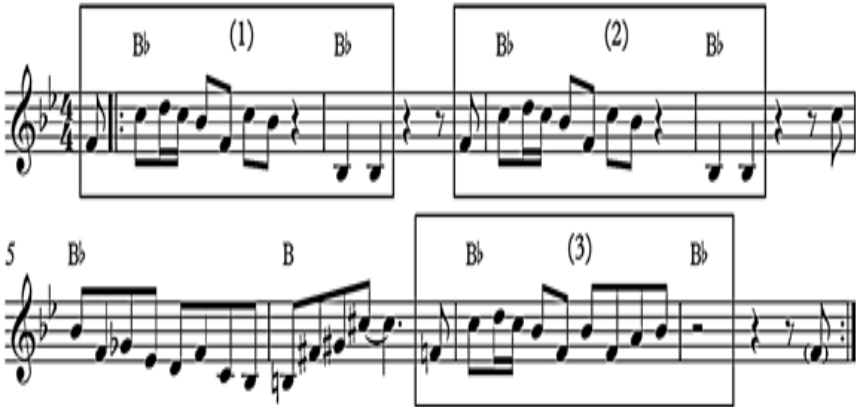
ภาพที่ 2 : แนวทำนองหลักและการดำเนินคอร์ดท่อน A ห้องที่ 1-16 บทเพลง Red Cross

ภาพที่ 3 แสดงการดำเนินคอร์ดท่อน A บรรทัดบนเป็นการดำเนินคอร์ดบทเพลง Red Cross บรรทัดล่างเป็นการดำเนินคอร์ดบทเพลง I've Got Rhythm สังเกตได้ว่าการดำเนินคอร์ดบทเพลง Red Cross มีความแตกต่างอย่างเห็นได้ชัด คือ มีการเคลื่อนที่ช้ากว่าและมีเพียง 2 คอร์ด ได้แก่ Bb และ B เท่านั้น ขณะที่การดำเนินคอร์ดบทเพลง I've Got Rhythm ประกอบด้วยห้องละ 2 คอร์ด และมีการเคลื่อนที่อย่างสม่ำเสมอ