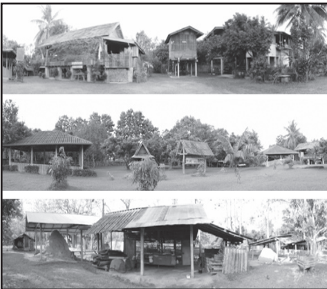
ภาพที่ 5 บริเวณพิพิธภัณฑสถานบ้านสวนแสนชื่น ที่แสดงให้เห็นถึงวิถีชีวิตของดาบตำรวจมนัส - คุณสุนัน ตีคำ และครอบครัว

3. วิถีชีวิตของดาบตำรวจมนัส - คุณสุนัน ตีคำ และครอบครัว คือ การดำเนินชีวิตที่เรียบง่าย อยู่แบบพอมีพอกิน ไม่เบียดเบียนหรือสร้างความเดือดร้อนให้แก่ใคร เป็นการดูแลจัดการพิพิธภัณฑสถานบ้านสวนแสนชื่นให้เป็นส่วนหนึ่งของวิถีชีวิต ผู้เยี่ยมชมพิพิธภัณฑสถานจะได้สัมผัสถึงพิพิธภัณฑสถานที่มีชีวิต ผ่านการดูแลจัดการพิพิธภัณฑสถานของดาบตำรวจมนัส - คุณสุนัน ตีคำ และครอบครัว อันเกิดจากการต้อนรับผู้ที่มาเยี่ยมชมอย่างกัลยาณมิตร นำชม บรรยายให้ความรู้แก่ผู้มาเยือน รวมทั้งการสัมผัสถึงวิถีชีวิตภายในบ้านที่สงบ ร่มรื่น กับวิถีที่เรียบง่าย ทั้งการทำสวน การได้ปลูกต้นไม้ที่หลากหลาย ปลูกไว้อย่างละต้นสองต้น ไม่ว่าจะเป็น ต้นสัก ต้นลำไย ต้นมะม่วง ต้นตำว (ต้นลูกชิต) ต้นมะไฟจีน ต้นมะขามป้อม ต้นเงาะ ต้นทุเรียน ฯลฯ ปลูกผักสวนครัว เลี้ยงไก่ เลี้ยงปลา เผาถ่านไว้ใช้เอง ตามวิถีที่เรียบง่าย สร้างบรรยากาศให้ร่มรื่นด้วยการปลูกดอกไม้ต้นไม้ตามฤดูกาล ทำตามศักยภาพและความสามารถที่มีอยู่ ไม่ต้องรอความช่วยเหลือจากใคร อยู่อย่างไรก็เป็นอยู่อย่างนั้น มีการเปลี่ยนแปลงตามบริบทและยุคสมัยที่เปลี่ยนแปลงไปบ้าง เพื่อให้ผู้มาเยี่ยมชมเห็นสิ่งที่เป็นตามธรรมดา ธรรมชาติ ภูเขาขึ้นสูงก็ตัดหญ้าทำเป็นกิจวัตร เมื่อมีแขกมาบ้าน ในฐานะเจ้าของบ้านก็ต้องไปต้อนรับแขก โดยถือว่าเป็นเรื่องปกติ และทำให้เราได้เกิดการเรียนรู้จากผู้มาเยี่ยมชมอีกด้วย (ดาบตำรวจมนัส ตีคำ. พฤตจิกายน 2556)