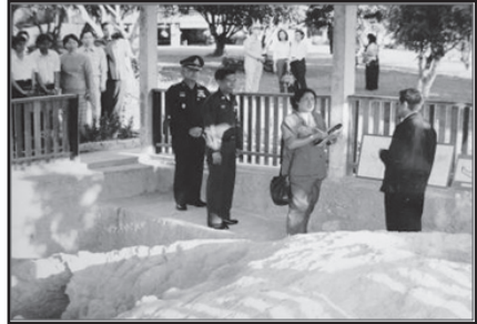
ภาพที่ 7 : สมเด็จพระเทพรัตนราชสุดาฯ สยามบรมราชกุมารี เสด็จพระราชดำเนิน ณ พิพิธภัณฑเฮือนบ้านสวกแสนขึ้น ในวันที่ 5 พฤศจิกายน พ.ศ. 2544