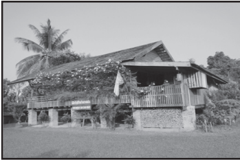
ภาพที่ 1 พิธีภัณฑ์เฮือนบ้านสวกแสนซิ่น

สุขของคนทำพิธีภัณฑ์ : มุมมองของคนในพิธีภัณฑ์เฮือนบ้านสวกแสนซิ่น