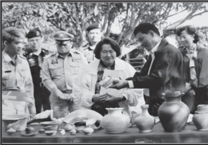
ภาพที่ 6 : สมเด็จพระเจ้าพี่นางเธอ กรมหลวงนราธิวาสราชนครินทร์ เสด็จพระราชดำเนิน ณ พิพิธภัณฑเตาเผาโบราณบ้านจ่ามนัส วันที่ 22 ธันวาคม พ.ศ. 2542

พิพิธภัณฑเฮือนบ้านสวกแสนขึ้น เป็นพิพิธภัณฑที่คนในครอบครัวช่วยกันดูแลรักษา และได้รับช่วยเหลือจากกัลยาณมิตรในลักษณะของการพึ่งพิงอิงอาศัยกัน อันเกิดจากความเข้าใจกันของคนในครอบครัว และดำเนินอยู่บนฐานของการพึ่งตนเองมาตลอดระยะเวลา 15 ปี ผลที่ได้รับจากการดูแลจัดการพิพิธภัณฑเฮือนบ้านสวกแสนขึ้น นำมาซึ่งความสุข มิตรภาพ และการแลกเปลี่ยนความรู้กับผู้คนที่หลากหลาย