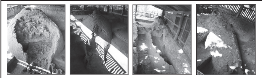
ภาพที่ 3 หลักฐานทางโบราณคดีแหล่งเตาเมืองน่านบ้านเตาไหแช่เลี้ยง ณ พิพิธภัณฑสถานบ้านสวกแสนชั้น เรียงจากภาพซ้ายไปขวา คือ เตาสุนัน เตาจ่ามนัส ตาแสนศรี และเตาชั้น