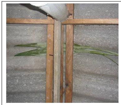
ภาพที่ 7 ใบสาครในการประกอบพิธีกรรม

ป่าสาครยังเกี่ยวข้องกับความเชื่อและพิธีกรรมอีกลักษณะหนึ่ง คือ การที่ชุมชนแสดงออกถึงความเคารพบรรพบุรุษและสิ่งที่ยุคบรรพบุรุษได้สั่งสมถ่ายทอดด้วยการบูชา แม้บรรพบุรุษเหล่านั้นจะล่วงลับไปแล้ว การเคารพผีบรรพบุรุษถือว่าเป็นการเคารพรากเหง้าของตนเอง พิธีกรรมที่แสดงออกถึงการให้ความเคารพดังกล่าว ได้แก่ การไหว้ครู หมอตายายในพิธีกรรมมโนราห์โรงครู พิธีกรรมที่ว่านนี้มีการนำ “พื้งราด” * ที่ทำมาจากใบเตยในป่าสาครมาใช้สานเป็นภาชนะสำหรับใส่ใส่ของเช่น ไห้ว นอกจากนี้ยังพบว่า หากพิธีกรรมขาดส่วนประกอบที่ได้จากต้นสาคร จะทำให้พิธีกรรมนั้นไม่ประสบผลสำเร็จ เช่น การนำสิ่งของไปแก้บน จะต้องใช้ทางสาครเป็นส่วนประกอบของพิธีกรรม จึงจะทำให้การแก้บนหรือแก้เหมยประสบความสำเร็จ เป็นต้น