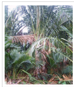
ภาพที่ 2 ต้นสาकु