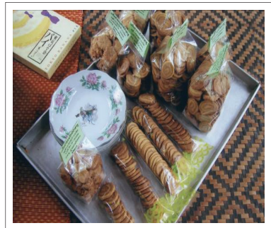
ภาพที่ 4 ผลิตภัณฑ์จากแปงสาคุ