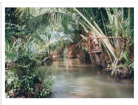
ภาพที่ 1 ระบบนิเวศป่าสาकु

เมื่อปี พ.ศ. 2522 เกิดน้ำท่วมใหญ่ในพื้นที่จังหวัดตรัง ภาครัฐสรุปว่าป่าสาकु เป็นต้นเหตุของน้ำท่วม เพราะป่าสาकुเป็นสิ่งกีดขวางทางน้ำ ทำให้น้ำไหลไม่สะดวก ภาครัฐ จึงได้ขุดลอกคลองและสร้างฝายกักเก็บน้ำเพื่อแก้ปัญหาดังกล่าว ผลปรากฏว่า กุ้ง หอย ปู ปลา มีจำนวนลดลงอย่างน่าตกใจ ขณะที่ชาวบ้านได้ข้อสรุปว่า คลองที่มีป่าสาकुยังคง มีสภาพความอุดมสมบูรณ์ของสัตว์น้ำเหมือนเดิม (ประภาส รัตนะ, สัมภาษณ์. 2554)