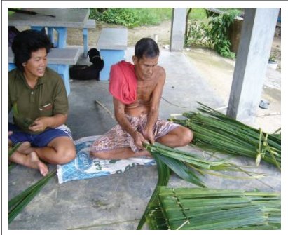
ภาพที่ 6 การทำจากมุงหลังคาจากใบสาकु