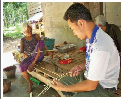
ภาพที่ 5 เตรียมวัสดุในการสานเสื่อ

กัลยาณมิตร อานันท์ กาญจนพันธุ์. 2543 กล่าวว่า การรวมตัวเช่นนี้เป็นการร่วมกันหาแนวทางแก้ไข เป็นระบบความสัมพันธ์บนพื้นที่ทางสังคมในรูปแบบใหม่จากการสร้างเครือข่ายการจัดการทรัพยากร ที่ร่วมมือกันในการอนุรักษ์ทรัพยากรทั้งระบบนิเวศ