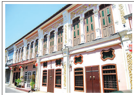
ภาพที่ 2 อาคารแบบซิโน - โปรตุเกส จ.ภูเก็ต

สำหรับสถาปัตยกรรมของปีนังส่วนใหญ่ นั้นได้รับอิทธิพลจากอังกฤษ หรือมีลักษณะรูปแบบของยุโรปผสมจีน ซึ่งมีเอกลักษณ์เฉพาะตน ทำให้ชาวภูเก็ตที่มีฐานะมีโอกาสเห็นและนำแบบแปลนการก่อสร้าง และช่างผู้ทำการก่อสร้างมาจากปีนัง เพื่อมาสร้างที่เกาะภูเก็ตเป็นจำนวนหนึ่ง การก่อสร้างลักษณะอาคารแบบซิโน - โปรตุเกส หรืออาคารที่ผสมระหว่างสถาปัตยกรรมของจีนและโปรตุเกสมีความสง่างามภูมิฐานแบบยุโรป ทั้งมีความร่มเย็นสุขสบายและอากาศถ่ายเทได้สะดวกแบบจีน เพราะโครงสร้างส่วนใหญ่เป็นตึกก่ออิฐหรือเทคอนกรีตแบบยุโรป และมีบ่อน้ำในบ้านสำหรับการอุปโภคและบริโภค สำหรับอาคารแบบซิโน - โปรตุเกสนั้นยังคงสามารถพบเห็นได้ในตัวเมืองของจังหวัดภูเก็ต