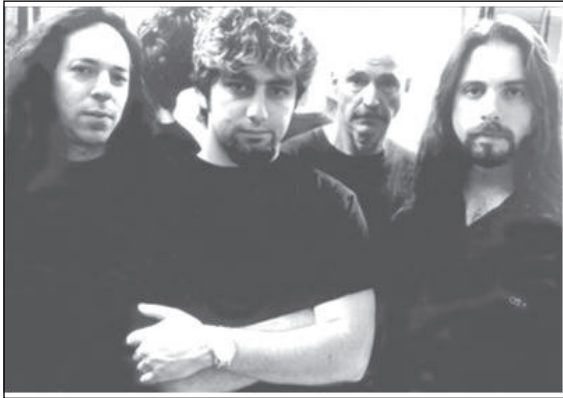
ภาพที่ 1 : สมาชิกวง Liquid Tension Experiment

(จากซ้ายไปขวา) จอร์แดน รูเดส / ไมค์ พอร์ตนอย / โทนี่ เลวิน / จอห์น เปตรูชี