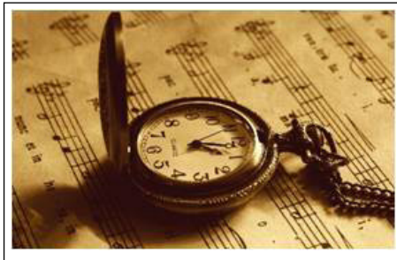
ภาพที่ 1 : Music and Times

ให้ทันเวลา เช่น การดำเนินชีวิตของมนุษย์ การทำงาน การเดินทาง จำเป็นต้องทำภารกิจหน้าที่ให้ทันเวลา แม้กระทั่งการรักษาเยียวยาชีวิตหากช้าไปเพียงเสี้ยววินาที นั้นหมายถึงความเป็นความตายของชีวิต ในขณะที่บางสิ่งบางอย่างต้องรอคอยเวลา เช่น การผลิตซีดี เครื่องดีเอ็มแอลกอฮอล์ ต้องรอคอยช่วงเวลาที่เหมาะสมจนเกิดเป็นคุณค่าขึ้นมา กว่าจะมา เป็นซีดีที่มีรสชาติอร่อย กว่าจะมาเป็นไวน์ เหล้า เบียร์ ที่มีรสชาติดีล้ำค่าผ่านกระบวนการหมัก การบ่ม ต้องพิถีพิถันเป็นระยะเวลาอันยาวนาน จะเห็นได้ว่าหลาย ๆ สิ่ง หลาย ๆ อย่าง มักขึ้นอยู่กับเงื่อนไขเวลา บางสิ่งจะเกิดคุณค่า ณ ช่วงเวลานั้น ๆ ในขณะที่บางสิ่งต้องใช้ การรอคอยเวลาอันยาวนานถึงจะเกิดเป็นคุณค่า เพื่อทำความเข้าใจในเนื้อหาเรื่องของ เวลาและคุณค่าทางดนตรี ผู้เขียนจะขอกกล่าวถึงการนิยามความหมายและทฤษฎี อันประกอบด้วย ทฤษฎีใหม่เกี่ยวกับเวลา คุณค่าและประเภทของคุณค่า บรรทัดฐานแห่ง คุณค่า เกณฑ์ตัดสินคุณค่าทางสุนทรียศาสตร์ และการวินิจฉัยคุณค่า ตามลำดับ