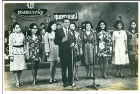
ภาพที่ 3 : วงสุนทราภรณ์