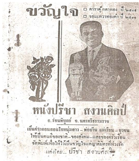
ภาพที่ 1 แสดงต้นฉบับของวรรณกรรมคำสอนภาคใต้ “ฉบับพิมพ์เล่มเล็ก”