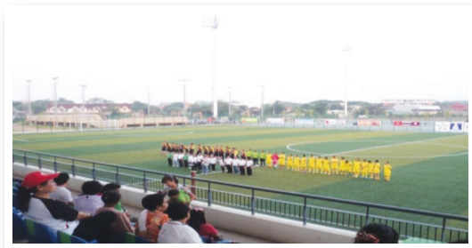
ภาพที่ 1 การแข่งขันฟุตบอลไทยลาวเวียดนามดำเนินการโดยนักการเมืองชาวไทยเชื้อสายเวียดนาม

ศาลเจ้าเงิน ฮึง ต่าว ซึ่งเป็นศาลเจ้าของชาวไทยเชื้อสายเวียดนามซึ่งอยู่กลางเมืองอุดรธานี การเสียดสละ การแบ่งปัน และการช่วยเหลือของครอบครัวสร้างนั้น เป็นการสะสมสิทธิอำนาจเชิงบุญบารมีของครอบครัวสร้างและนำมาสู่การมีเกียรติยศของสังคม